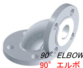
90° ELBOW 90° エルボ