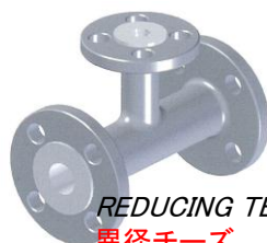
REDUCING TEE 異径チーズ