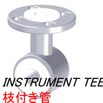
INSTRUMENT TEE 枝付き管