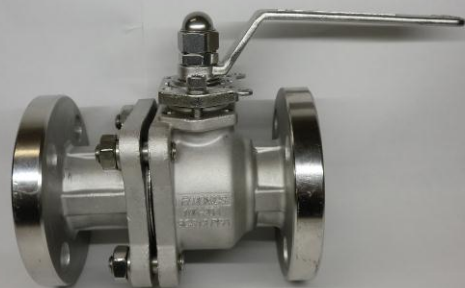
BALL VALVE ボールバルブ