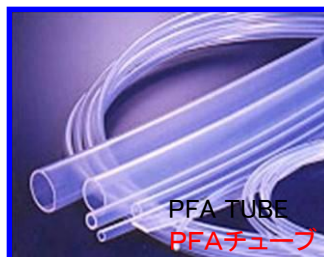
PFA TUBE PFAチューブ