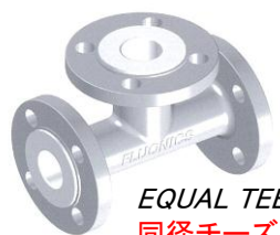
EQUAL TEE 同径チーズ