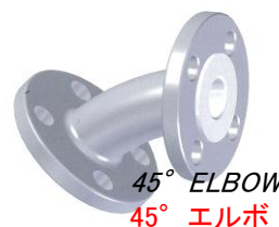
45° ELBOW 45° エルボ