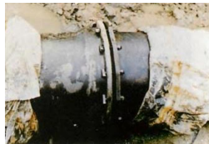
ポリエチレンスリーブの防食効果