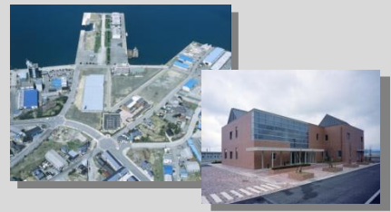
七尾市中央水質管理センター