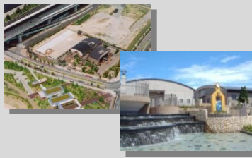
南芦屋浜下水処理場