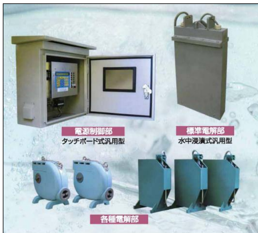
ミネラリー製品群